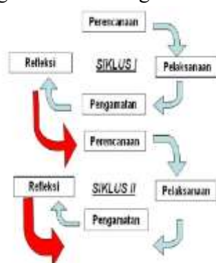
Gambar 1. Daur Penelitian Tindakan Kelas (PTK).

Penelitian ini merupakan penelitian tindakan kelas (PTK) atau dalam istilah Bahasa Inggris disebut classroom action research (CAR). PTK adalah suatu pendekatan untuk meningkatkan Pendidikan dengan melakukan perubahan kearah perbaikan terhadap hasil penelitian dan pembelajaran. Secara garis besar terdapat empat tahapan yang lazim dilalui dalam penelitian ini yaitu perencanaan, pelaksanaan, pengamatan (observasi), dan refleksi. Empat kaitan tersebut saling berkaitan dalam pelaksanaan PTK, secara virtual tahapan PTK menurut Kemmis dan Mc Taggart adalah sebagai berikut: