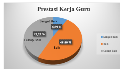
GAMBAR 3 DESKRIPSI PERSENTASE PRESTASI KERJA GURU MADRASAH ALIYAH NEGERI SE KABUPATEN HULU SUNGAI TENGAH